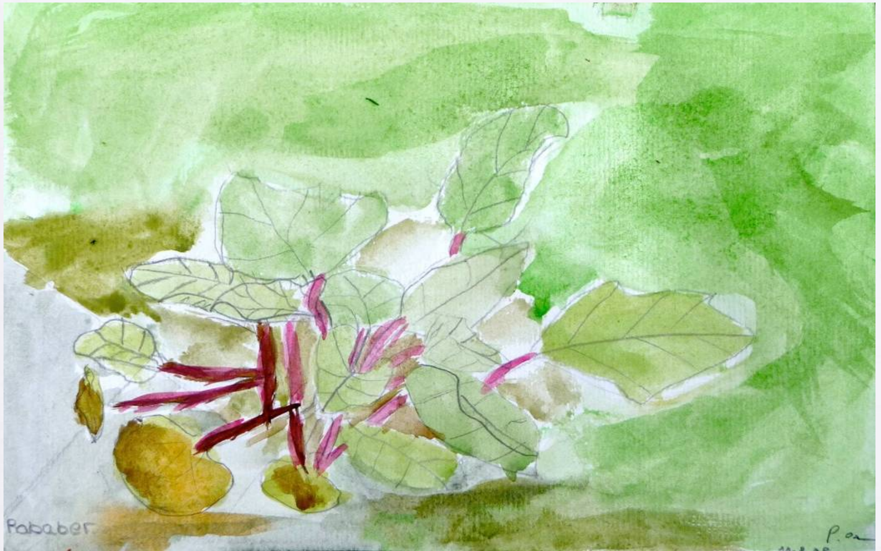
„Rhabarber“, Bleistift, Wasserfarben