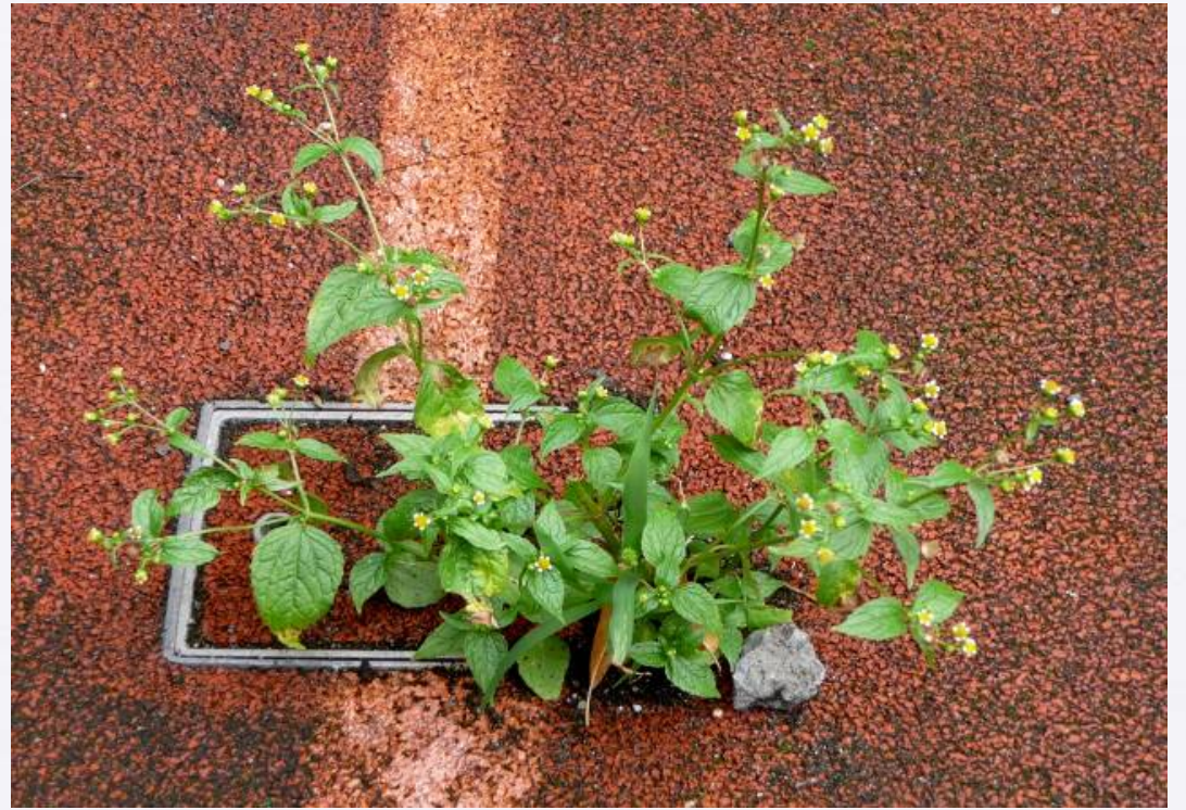
Fotos vom Schulhof