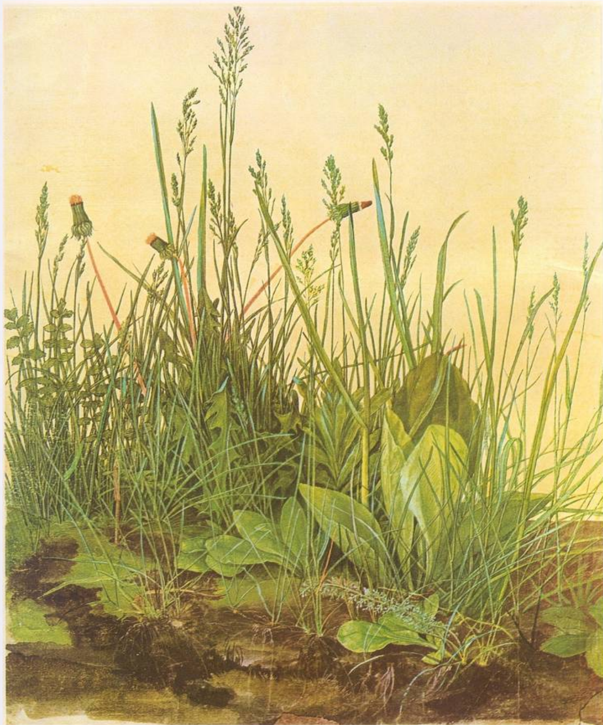
Albrecht Dürer „Das große Rasenstück“ 1503, Bleistift, Wasser- und Deckfarben